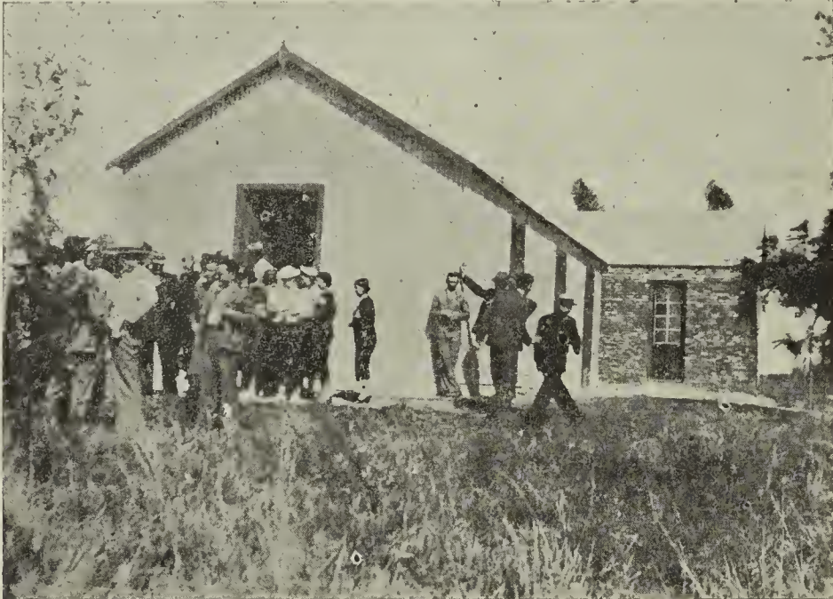
Asamblea de las U. C. en Nueva Valdense. —Frente al templo durante un cuarto intermedio

Es urgente su completa resolución, porque una vez lograda enteramente se tornarán en los dos mejores aliados de los socios de las Uniones Cristianas de Jóvenes que podrán cumplir en el máximo de sus capacidades